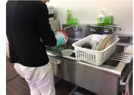
就労移行支援 食器洗い