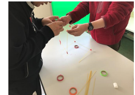
就労移行支援 コミュニケーショントレーニング