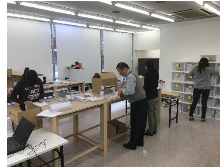
就労継続支援 A 型 発送業務