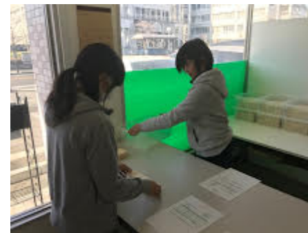
就労移行支援 物流訓練